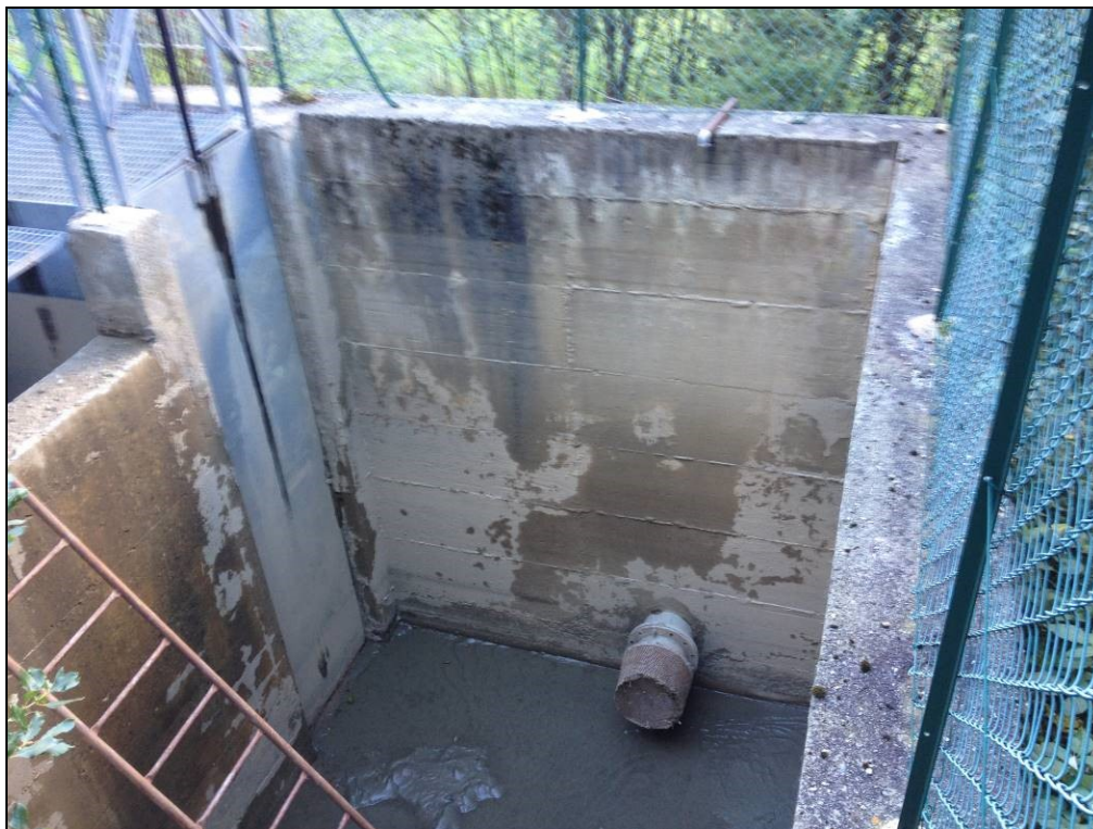
Foto 7: VASCA ESISTENTE DEL CMF AL T.BERROVARD E VASCA DI CARICO DELLA CENTRALE, TUBAZIONE IRRIGUA, FUTURA CONDOTTA FORZATA DELL'IMPIANTO