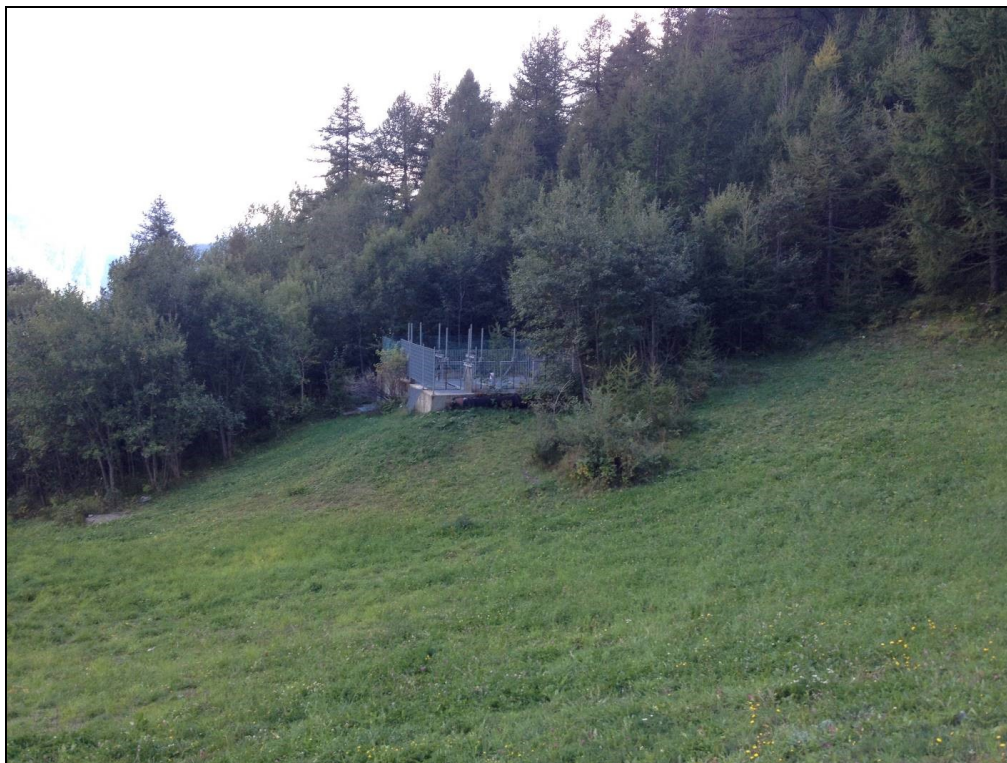
Foto 5: VASCA ESISTENTE DEL CMF AL T. BERROVARD E VASCA DI CARICO DELLA CENTRALE, BACINO RICETTORE DELLE ACQUE DEL T. EAUX BLANCHES E BERROVARD