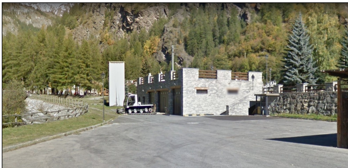
Foto 10: CABINA-TORRE ESISTENTE CHE VERRÀ SMANTELLATA

(la struttura utilizzata dalla Pro Loco è attualmente in fase di smantellamento. Il locale consegna sorgerà interrato, con accesso a filo muro, sul lato opposto rispetto ai “molor” visibili sul lato destro della foto)